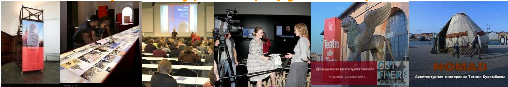
Представление творчества ведущих российских архитекторов, анализ и предъявление урбанистических трансформаций городов постсоветской России